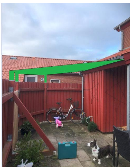
*Illustration af halvtag